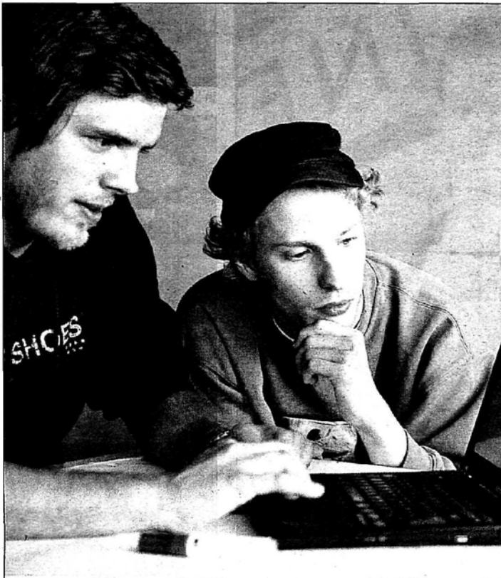
Interessante Einblicke in die verschiedenen Studien- und Lehrgänge an der FHV gibt es am kommenden Samstag ab 9.30 Uhr.

Die Hochschule arbeitet dabei mit unterschiedlichsten Lehr- und Lernformen. Das spiegelt sich im