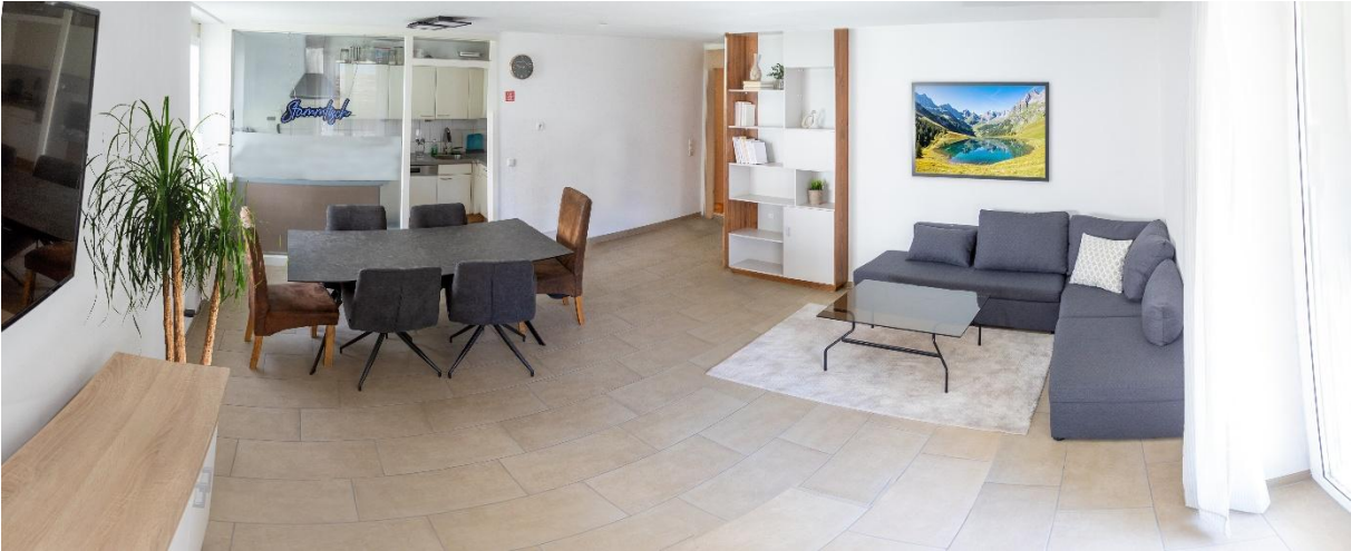
Bilder der Wohnung (Einrichtungsvorschlag):