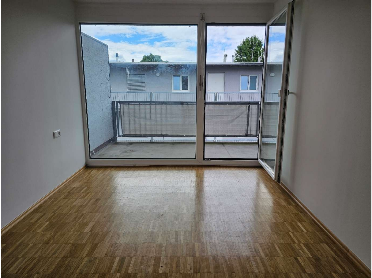
Blick vom Schlafzimmer ins Freie