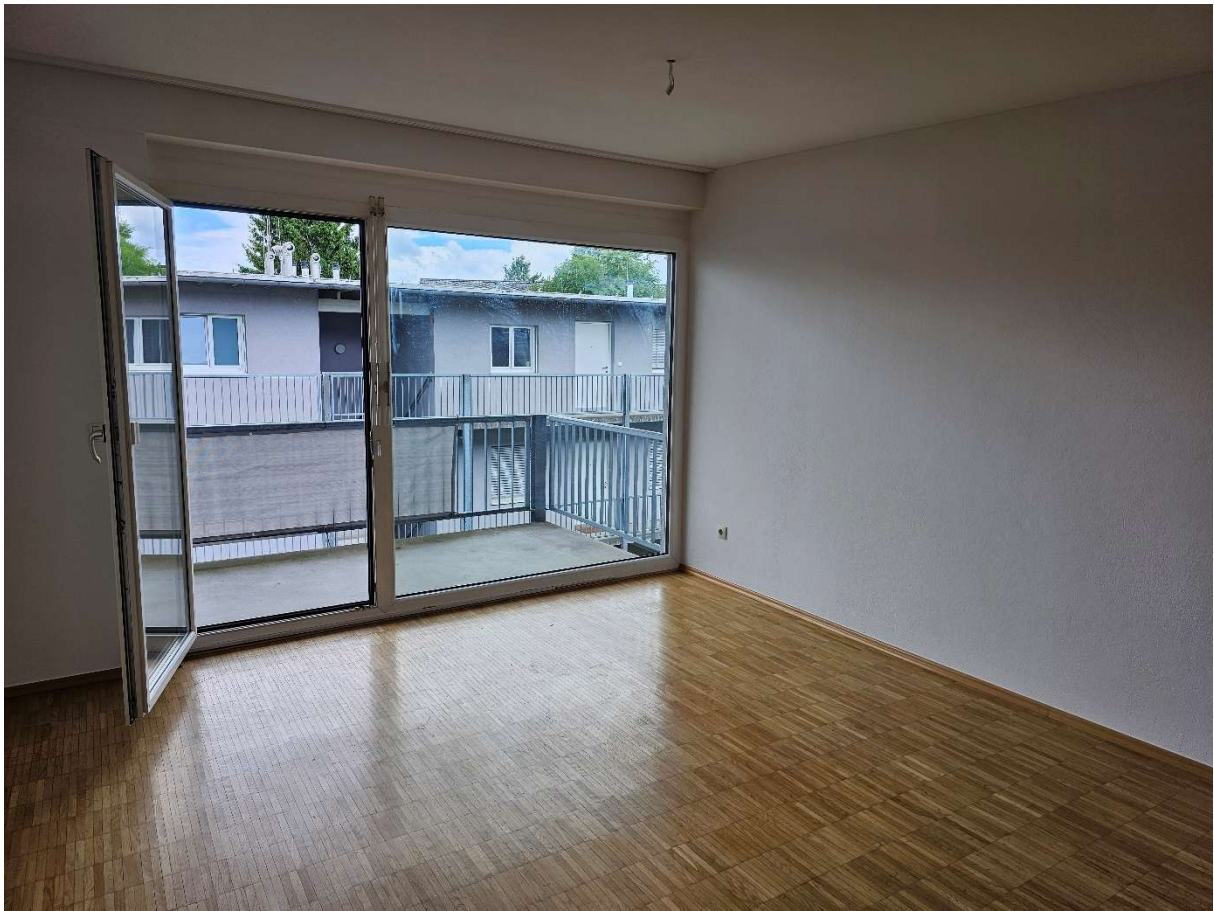
Blick v. Wohnzimmer ins Freie